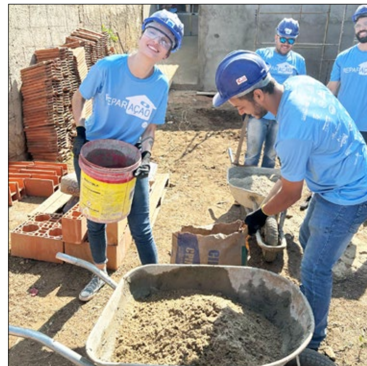
A ONG conta com voluntários, que com muito trabalho e empatia, tornam sonhos realidade