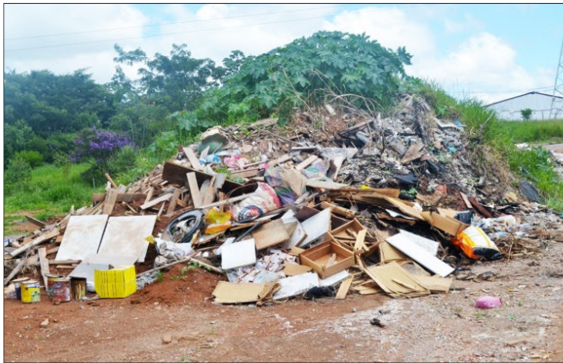
GB já flagrou incontáveis locais de descarte irregular de resíduo sólido. A maioria na Zona Norte da cidade. Nesta foto Lixo no Jardim Vista Alegre

Com o objetivo de prevenir e controlar a poluição causada por descartes irregulares