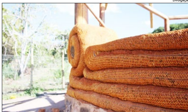
O hiperadobe é uma técnica de bioconstrução que utiliza sacos de malha aberta

O hiperadobe é uma técnica de bioconstrução que utiliza sacos de malha aberta (raschel) preenchidos com terra, que são compactados para formar paredes autoportantes e estruturais. É uma alternativa sustentável e econômica à construção tradicional, utilizando materiais locais e reduzindo o impacto ambiental. A técnica foi criada no Brasil pelo engenheiro Fernando Pacheco, inspirada na