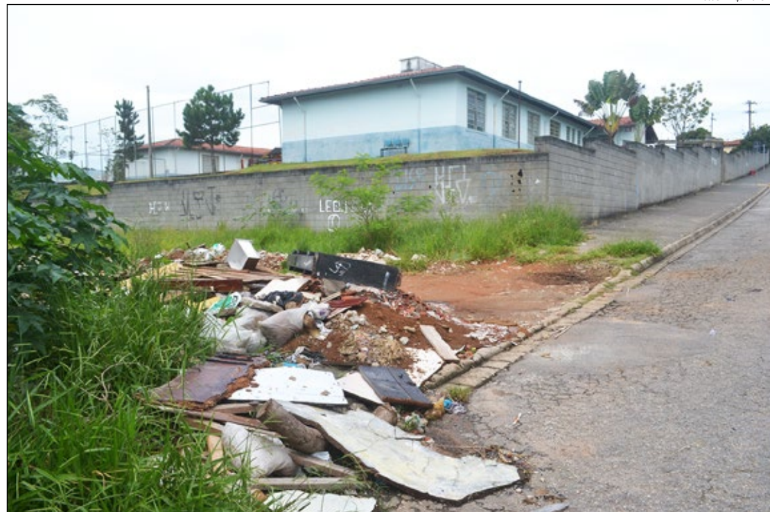
Mais um flagrante da GB, de entulho despejado em terreno atrás de escola na Planejada II

do os geradores de resíduos a apresentar documentos comprobatórios da destinação dos