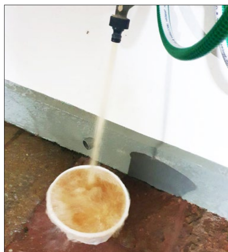
Água barrenta e imprópria para consumo após horas de desabastecimento

ção. A Sabesp retornou com a seguinte nota: "A Sabesp informa que realizou uma manutenção emergencial, na manhã de segunda-feira (21), no sistema que bombeia água para o Jardim América. O reparo foi concluído às 8h48, e o abastecimento no bairro foi normalizado de forma gradual ao longo da própria segunda-feira, com o avanço da água pelas tubulações da região. A Companhia pede desculpas pelos transtornos gerados pelo serviço emergencial."