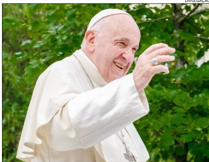
O Papa Francisco, primeiro pontífice latino-americano e jesuíta da história da Igreja Católica, faleceu nesta segun-

da-feira (21), aos 88 anos, em sua residência no Vaticano, a Casa Santa Marta. Segundo o Vaticano, a causa da morte foi um acidente vascular cerebral (AVC), seguido de insuficiência cardíaca irreversível. O pontífice estava internado desde fevereiro, quando enfrentou complicações respiratórias.