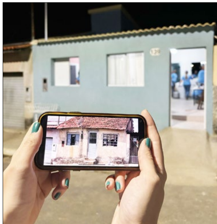
Uma das Reparações feitas pela ONG. Uma casa que estava em condições precárias de moradia, totalmente reformada

Em busca de proporcionar um lar seguro para famílias, a ONG nasceu como um pequeno projeto e hoje já conta com mais de 100 voluntários, se preparando para mais uma reforma no próximo mês