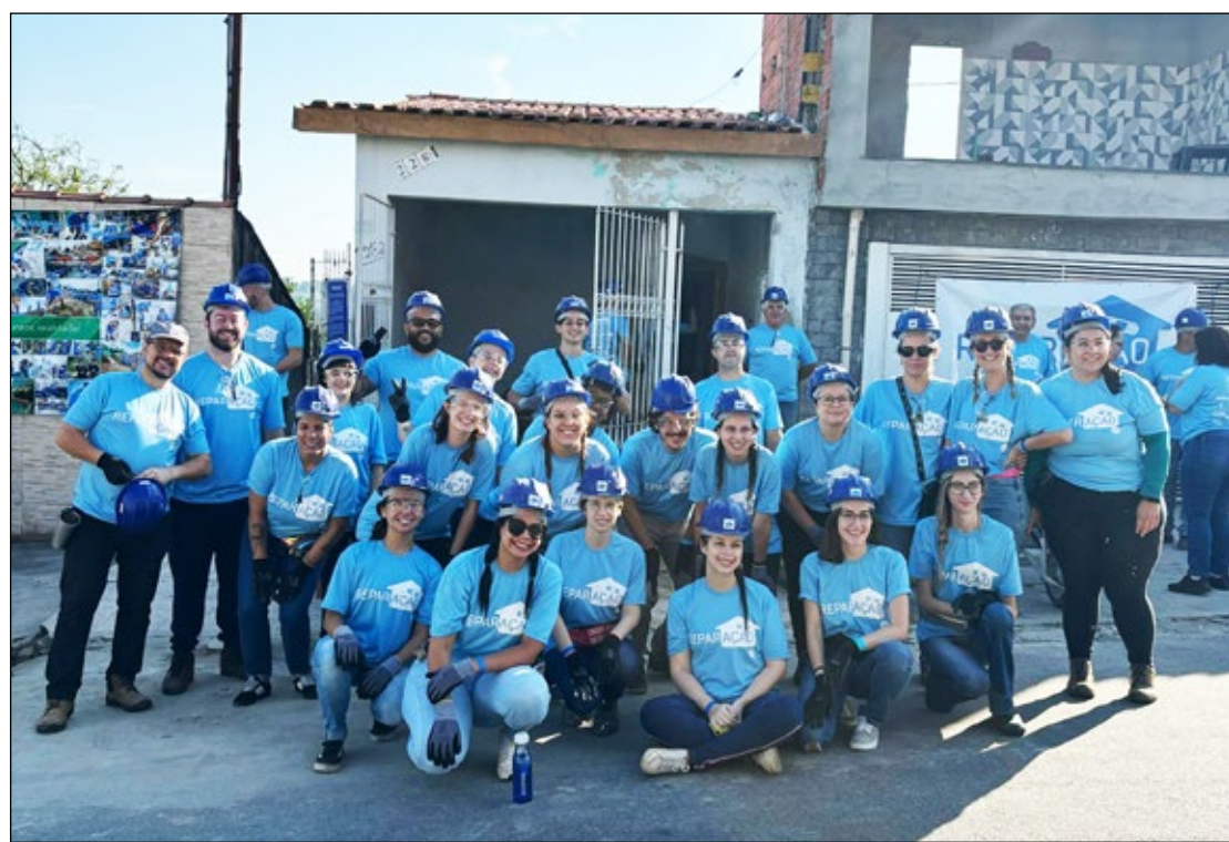
7 Com 12 anos de história, a ONG Reparação já conta com mais de 120 voluntários e uma equipe com mais de 30 integrantes. Foram 25 famílias até o momento que tiveram suas vidas mudadas após receber um lar digno, feito com empatia, solidariedade e muito trabalho

“Sonho que se sonha só é só um sonho que se sonha só. Mas sonho que se sonha junto é realidade.” (Raul Seixas e Paulo Coelho)