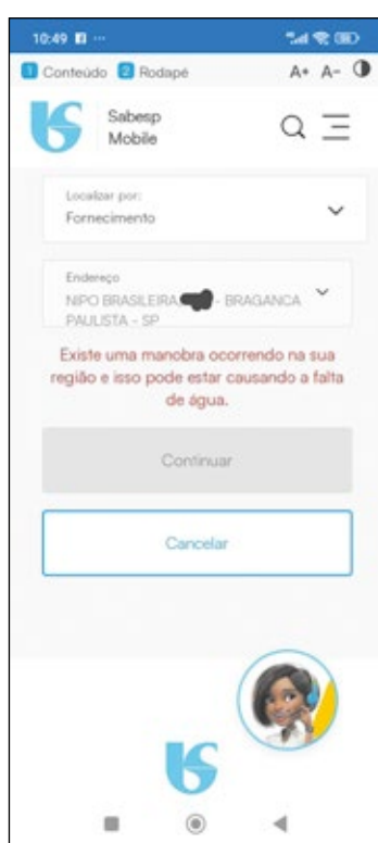
Contato de um dos moradores logo na manhã de domingo (20)

Mais uma vez a GB entrou em contato com a SABESP, através de sua assessoria de imprensa para saber o que aconteceu entre domingo e segunda para a suspensão do abastecimento, porque o usuário não foi avisado previamente e ainda qual medida o consumidor poderia tomar diante daquela situa-