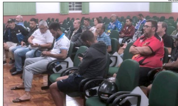
Reunião entre dirigentes definiu o calendário 2025 que começa hoje

Campeões - Ao longo da história da Série A, foram 19 equipes campeãs. A primeira edição foi realizada em