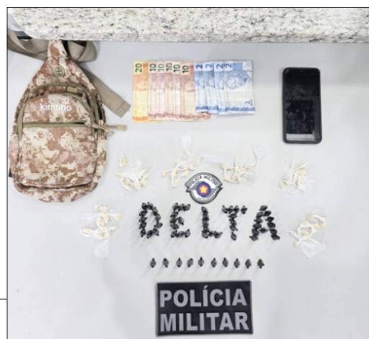
Drogas apreendidas pela equipe Delta da PM

R$ 78,00 em dinheiro trocado. D. foi conduzido ao Plantão Central da Polícia Civil, onde foi dado cumprimento ao mandado de prisão, sendo ele também autuado em flagrante por tráfico de drogas e apresentado em audiência de custódia.